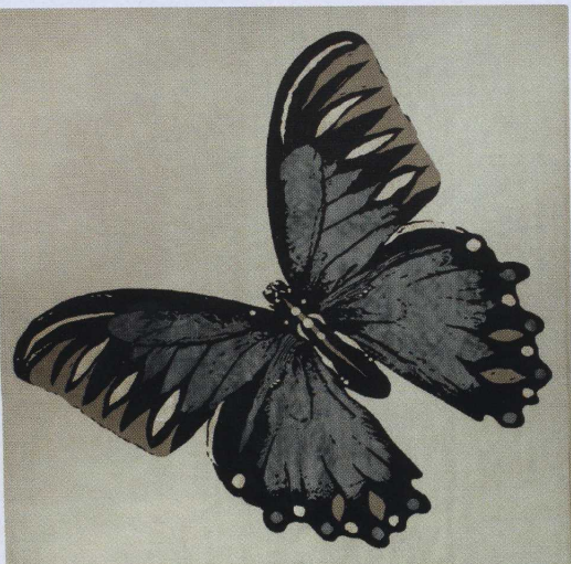
BUTTERFLY KISS Pièce de Résistance einer neuen Teppich- und Kissenserie, die In-Designerin Tara Bernerd für die Londoner Rug Company entwarf: „Papillon“ wird in der gewünschten Größe aus tibetischer Wolle und Seide handgewebt. Pro Quadratmeter 1080 £.