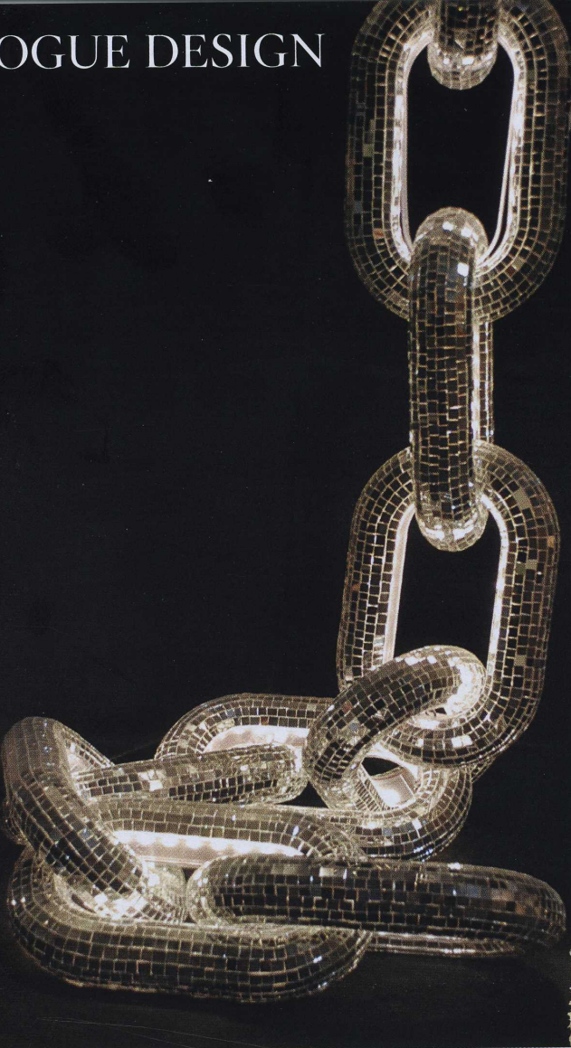
WUNDERLAMPE Von der Decke bis zum Boden hängend wirkt „Freedom“ am schönsten. Beliebige viele Module (36 x 23 cm) lassen sich kombinieren. Davide Medri, je 600 €.