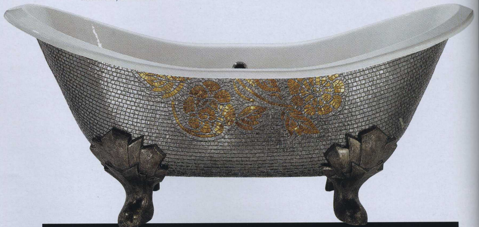
DISCO(HALB)KUGEL Innen nostalgische Emaille, außen Metallic-Mosaik: Die Badewanne „Alba“ gibt der Gattung Stehbewanne einen neuen Dreh. Sicis, ab 9500 €.