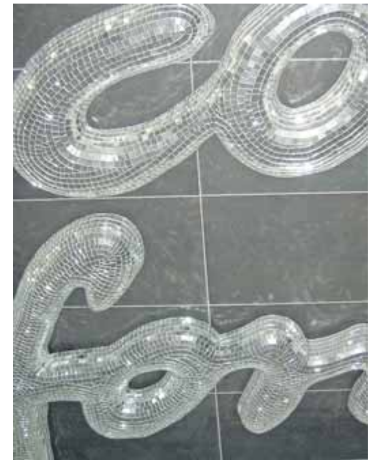
Kunst oder bloß kunstvoll? Die Spiegel-Lampen von Medri.