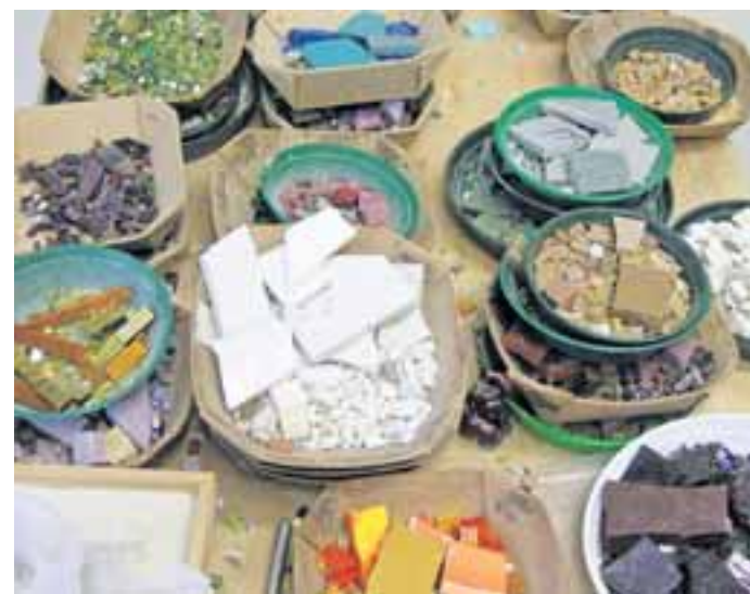
Tessarae, also Vierecke, werden die geschlagene Steine genannt.